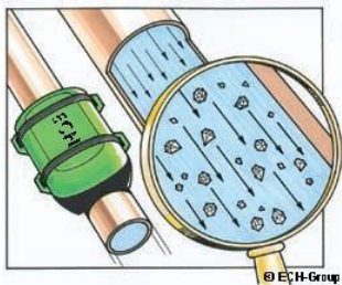
Nieuwe kalkaanslag maakt geen kans meer!