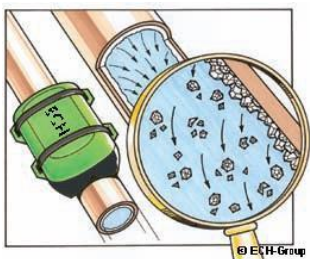
Na montage van de Alpine waterontharder new generation® laat de oude kalklaag los en vergruist.